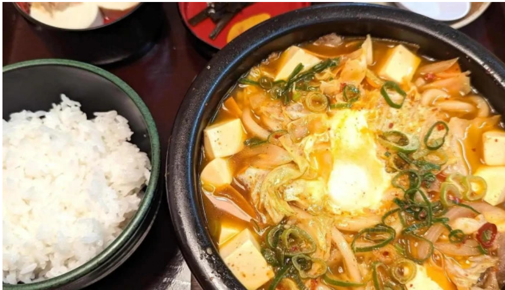
うちだ屋 人吉店 instagram