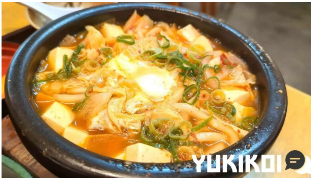
うちだ屋 人吉店 動画