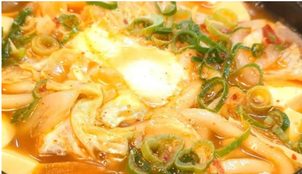
うちだ屋 人吉店 エリア