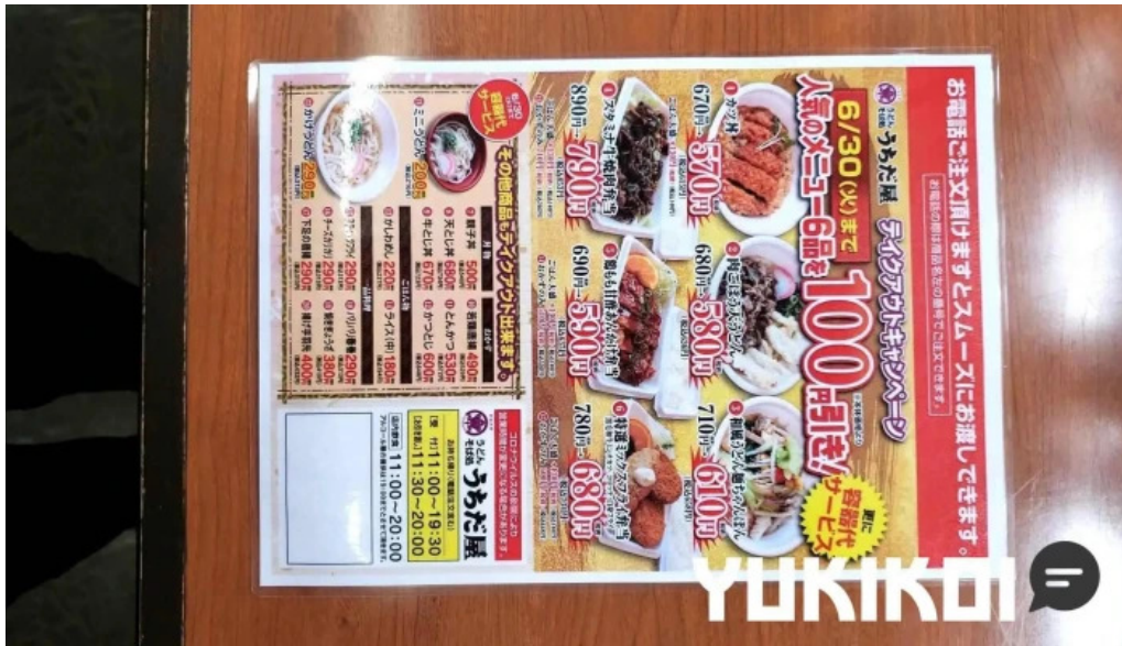
うちだ屋 人吉店 メニュー