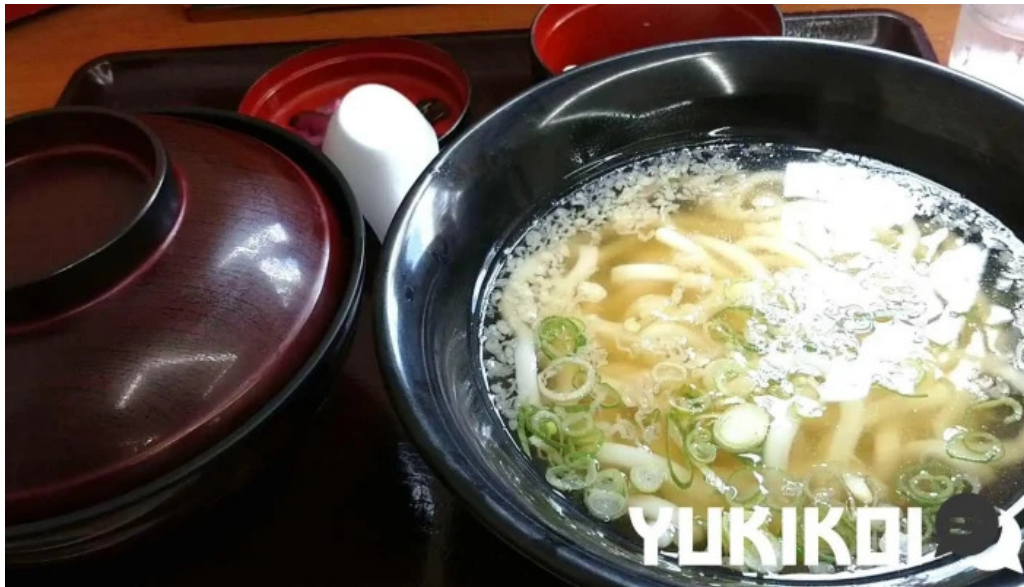
うちだ屋 人吉店 うどん