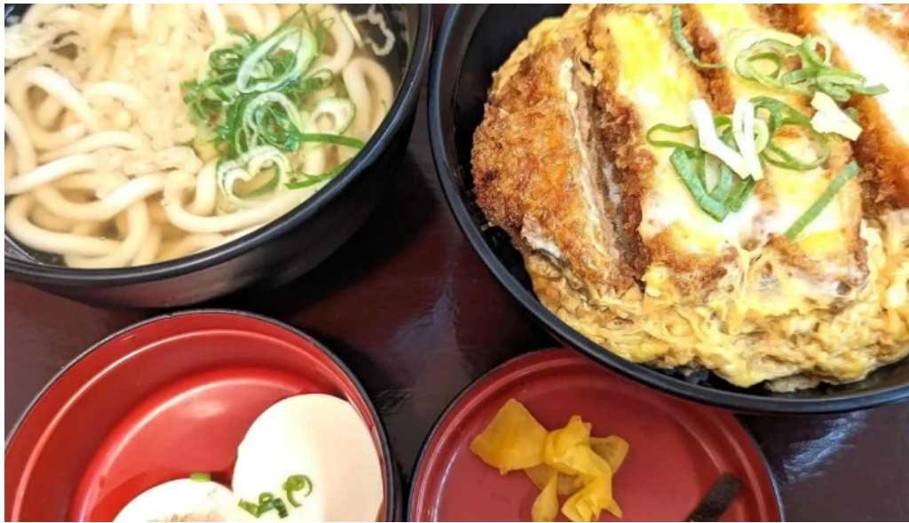
うちだ屋 人吉店 ウェブサイト