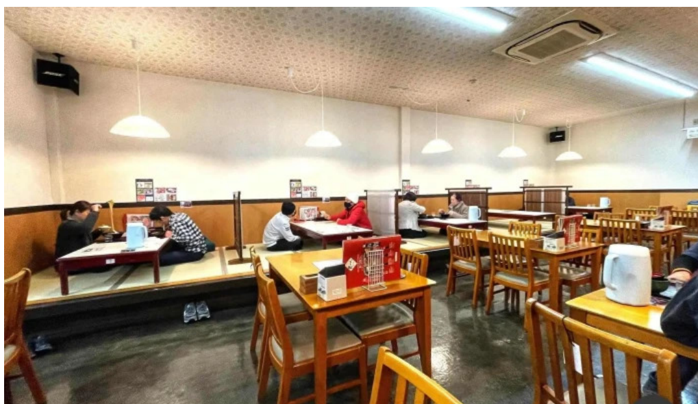
うちだ屋 人吉店 雰囲気