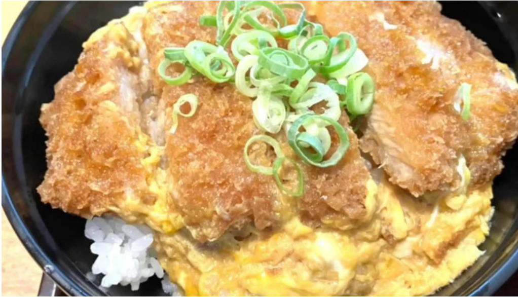
うちだ屋 人吉店 番号