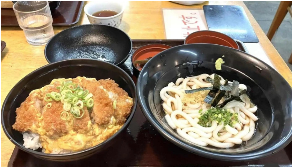
うちだ屋 人吉店 料理飲み物