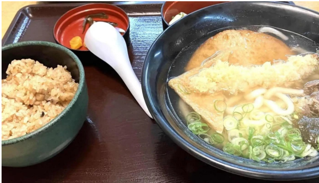
うちだ屋 人吉店 プロモーション