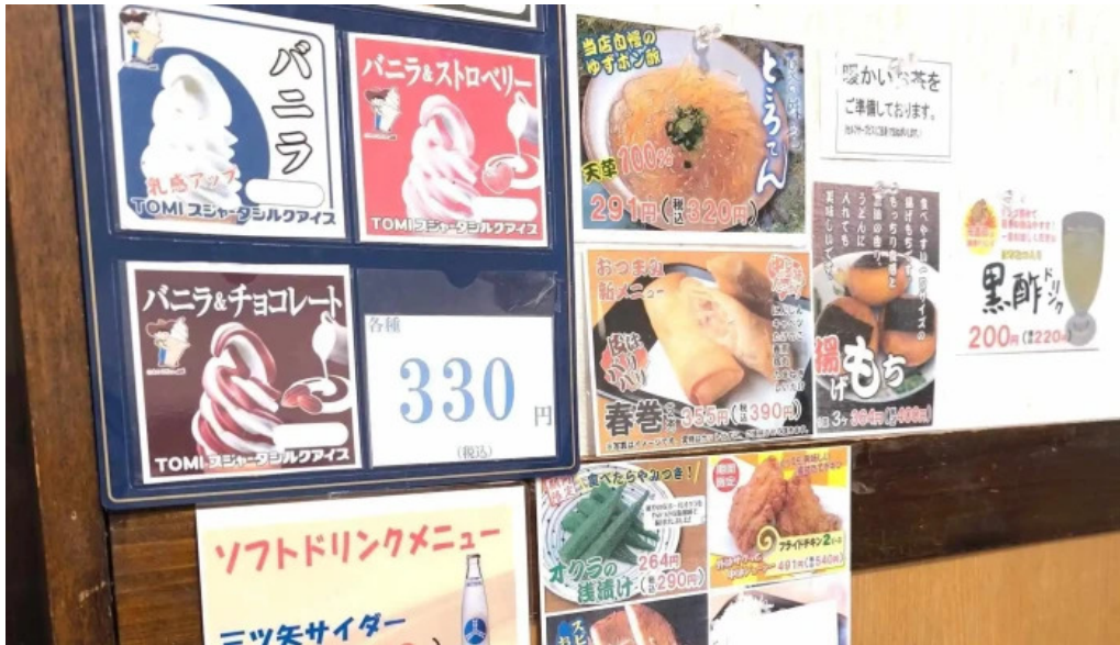
うちだ屋 人吉店 カタログ