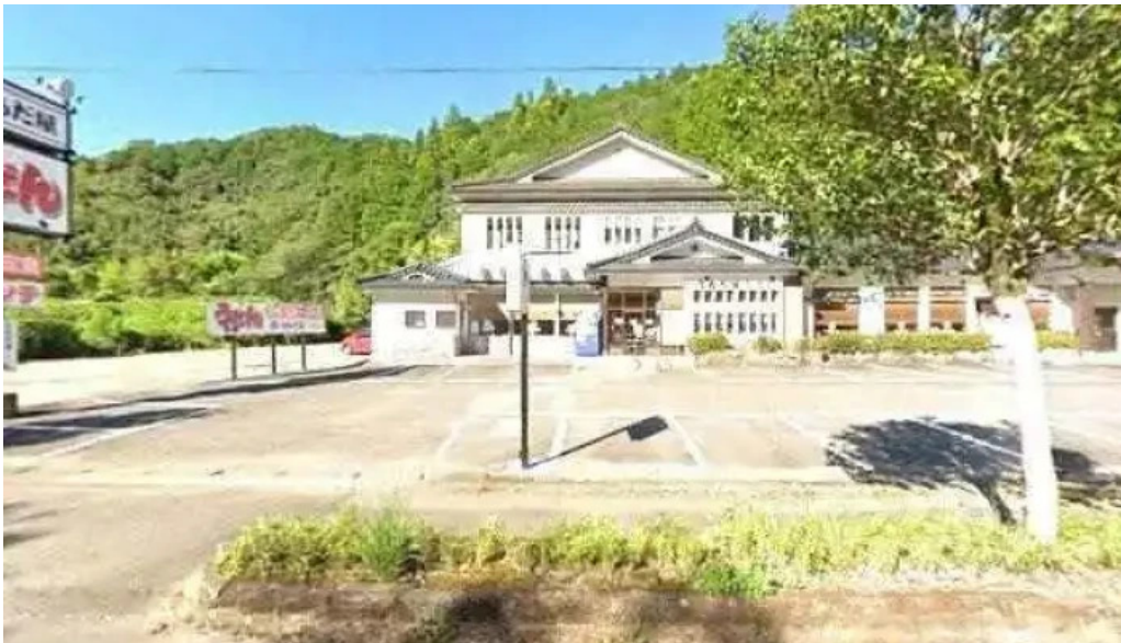
うちだ屋 人吉店 人吉市