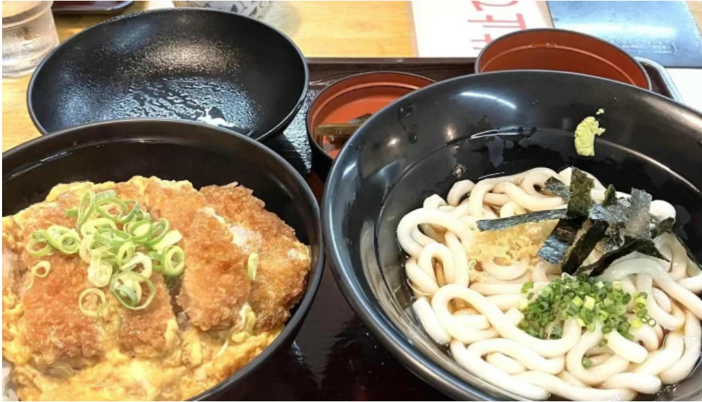
うちだ屋 人吉店 割引