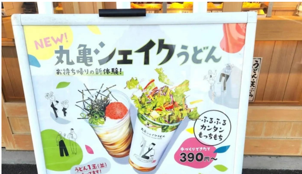
丸亀製麺さいたま中央 ウェブサイト