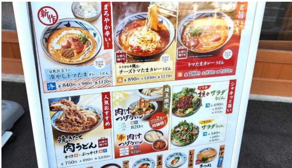
丸亀製麺さいたま中央 メニュー