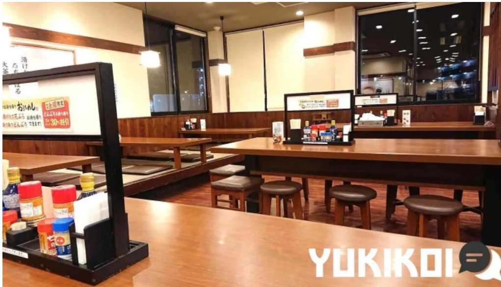
丸亀製麺さいたま中央 雰囲気