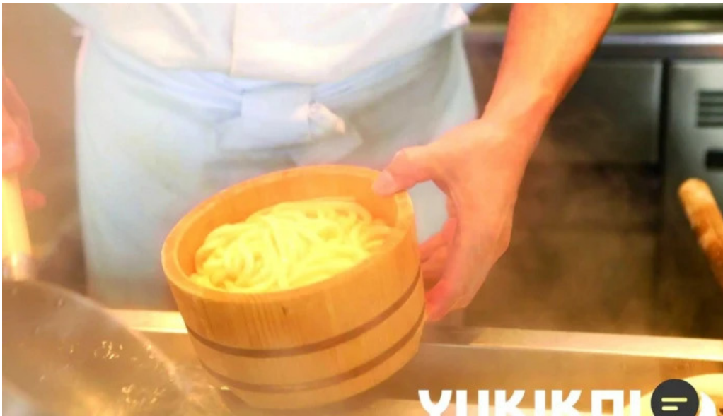
丸亀製麺さいたま中央