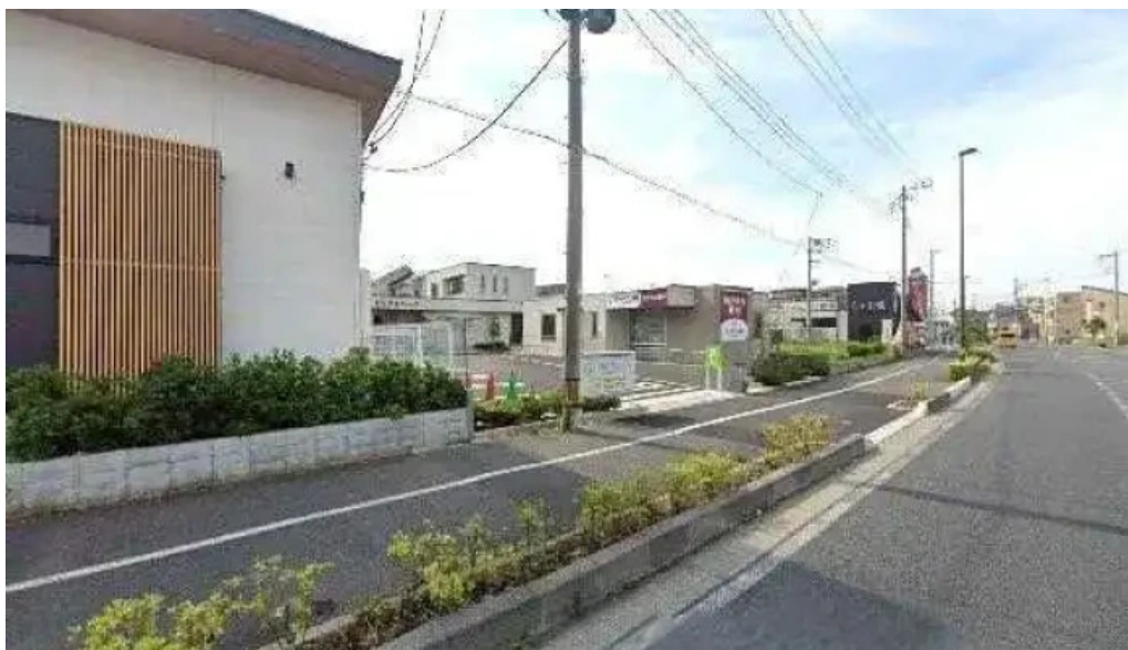
丸亀製麺さいたま中央 さいたま市