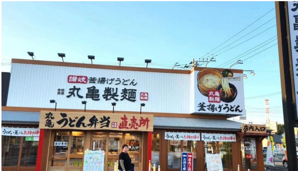
丸亀製麺さいたま中央 住所