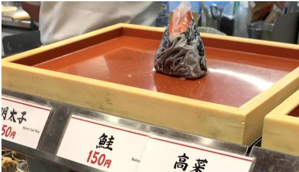
丸亀製麺さいたま中央 営業中