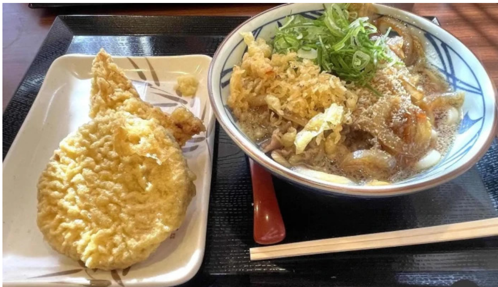
丸亀製麺さいたま中央 最新