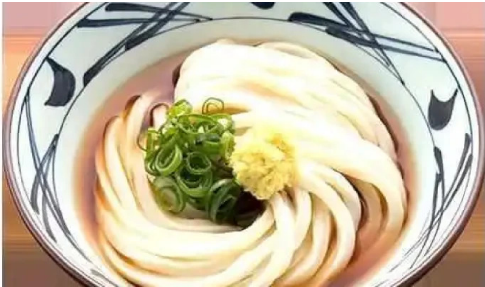
丸亀製麺さいたま中央 料理飲み物