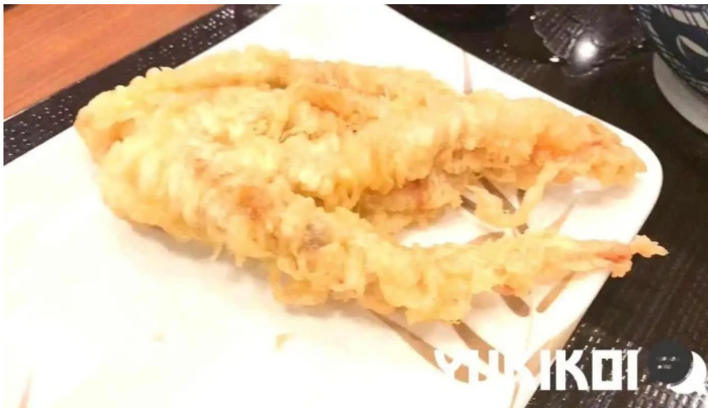
丸亀製麺さいたま中央 動画