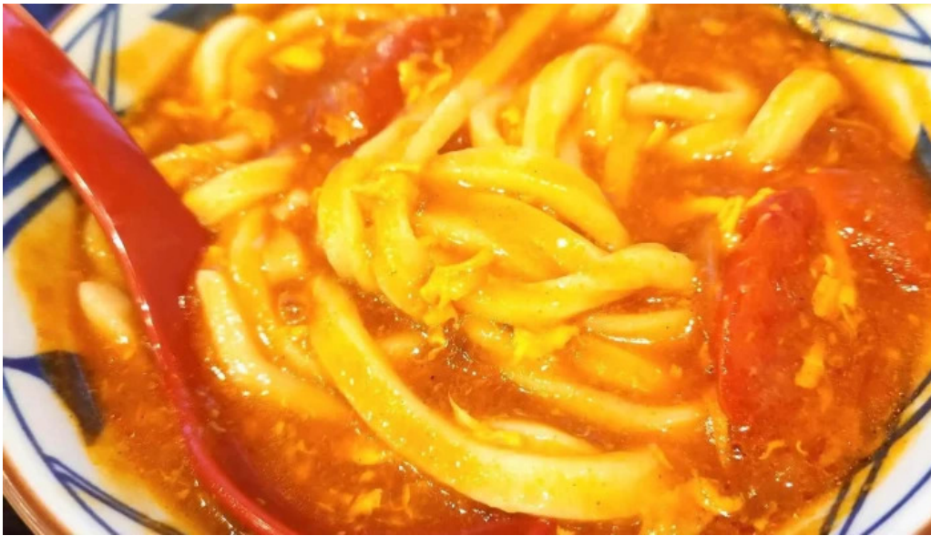
丸亀製麺さいたま中央 コメント