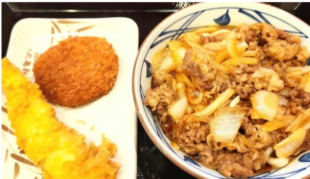
丸亀製麺さいたま中央 電話