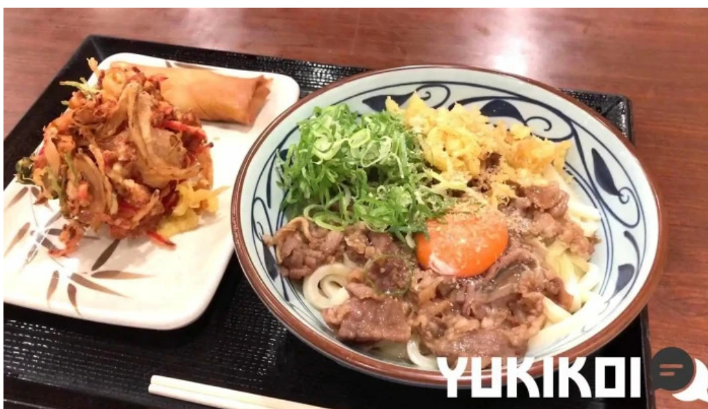
丸亀製麺さいたま中央 うどん