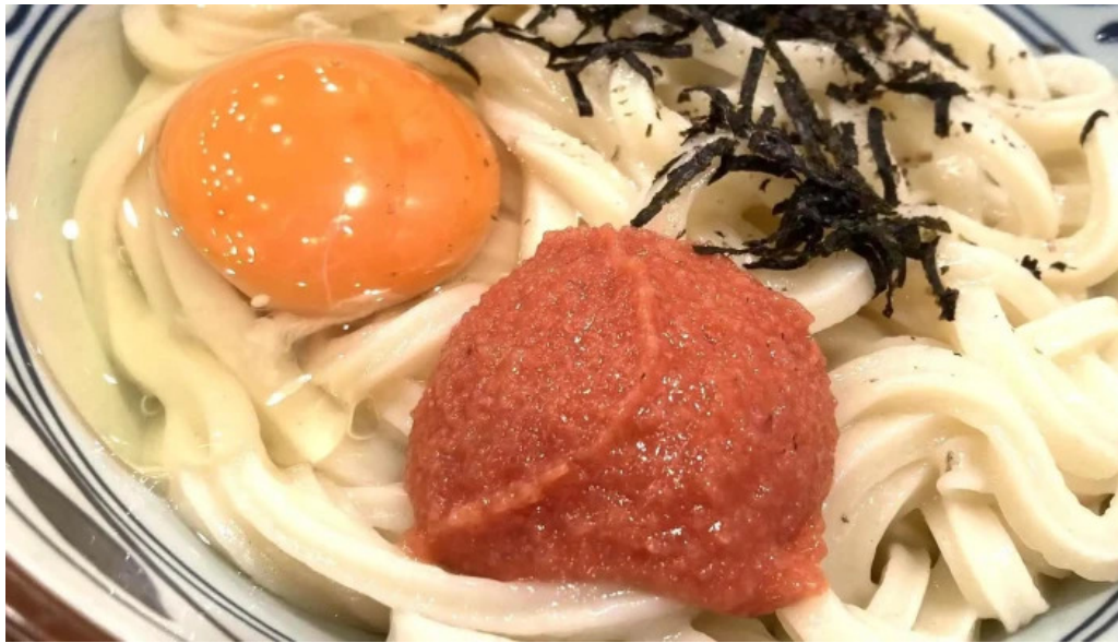
丸亀製麺さいたま中央 エリア