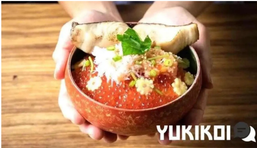
糸島ほたる