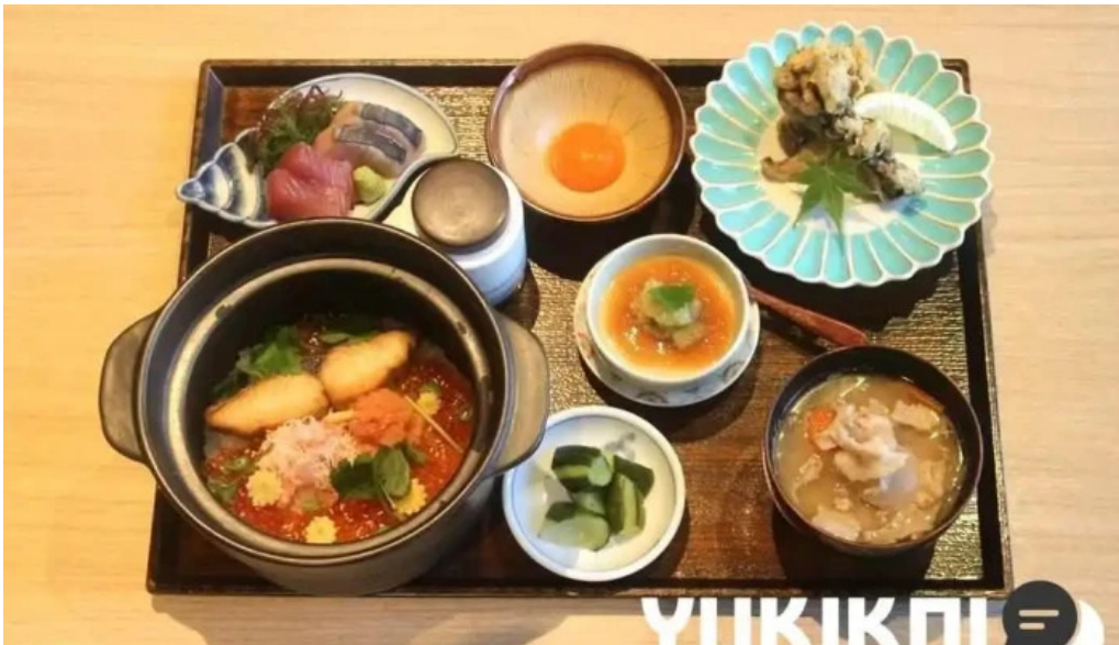
糸島ほたる スープ