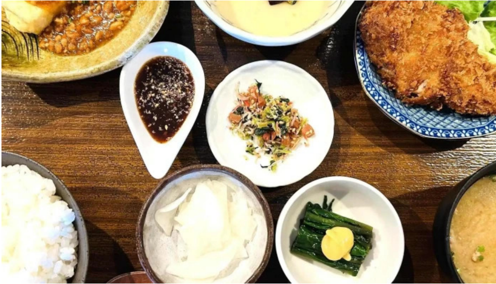
糸島ほたる 所在地