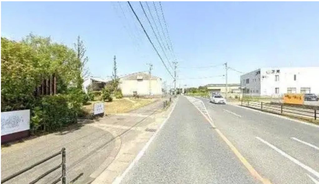
糸島ほたる 糸島市