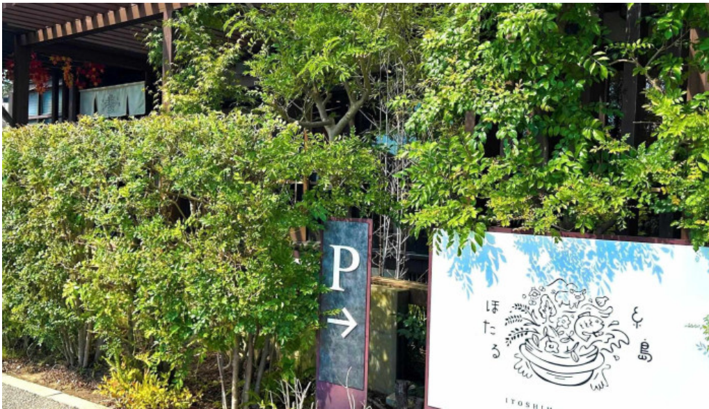
糸島ほたる ウェブサイト