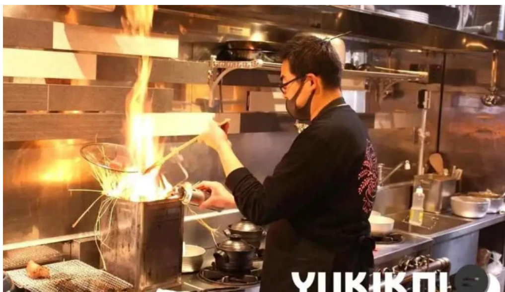
糸島ほたる 雰囲気