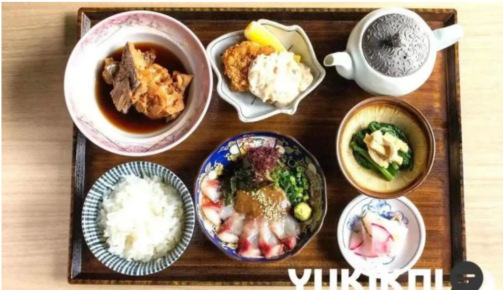
糸島ほたる 料理飲み物