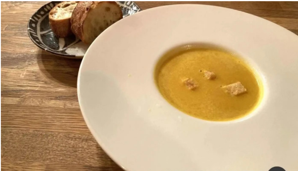
風人 かぼちゃスープ