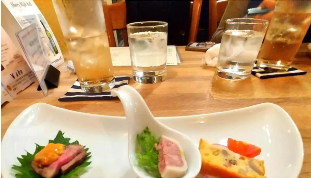
風人 プロモーション